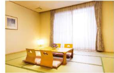
客室 (和室) 定員 5名様

和室・洋室・スイートルームなど色々なお部屋をご用意できます。ゆったりとくつろげる和室やオシャレな時間が楽しめる洋室など、用途に合わせてお選びいただけます。