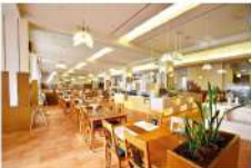
レストランカトレア