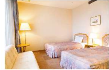
客室 (洋室) 定員 2名様

和室・洋室・スイートルームなど色々なお部屋をご用意できます。ゆったりとくつろげる和室やオシャレな時間が楽しめる洋室など、用途に合わせてお選びいただけます。